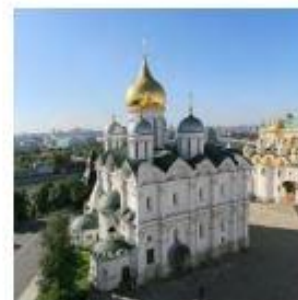
4. Архангельский собор в Московском Кремле