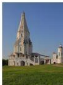
3. Церковь Вознесения Господня в Коломенском (Москва)