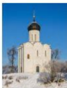
2. Храм Покрова Пресвятой Богородицы на Нерли